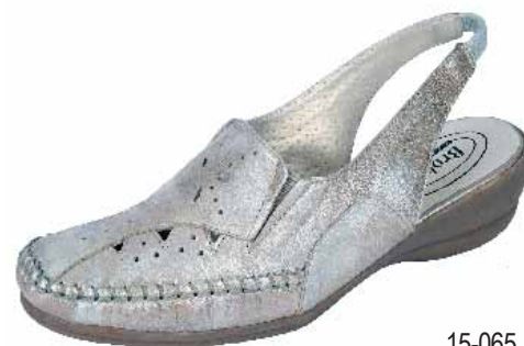
15-065 ΧΡΩΜΑ: ΜΠΕΖ, ΜΑΥΡΟ No: 36 - 41 Λ.Τ.: 65,00 €