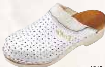
1013 ΧΡΩΜΑ: ΛΕΥΚΟ, ΜΠΛΕ, ΜΑΥΡΟ No: 35 - 41 Λ.Τ.: 36,00 €