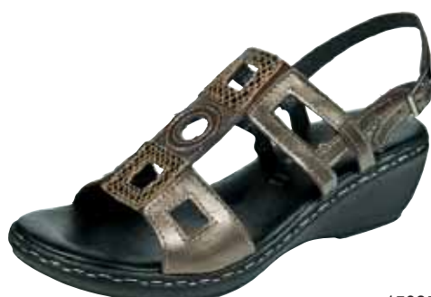
15825 ΧΡΩΜΑ: ΜΠΡΟΝΖΕ, ΜΑΥΡΟ No: 35 - 41 Λ.Τ.: 50,00 €