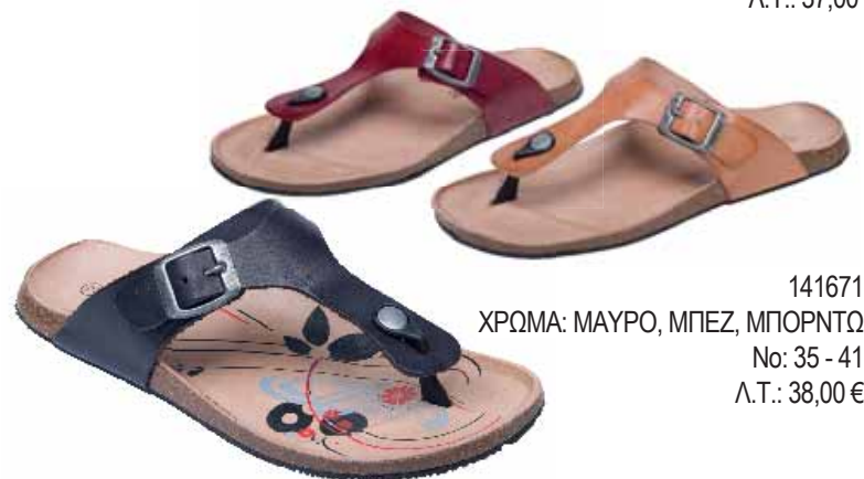
141671 ΧΡΩΜΑ: ΜΑΥΡΟ, ΜΠΕΖ, ΜΠΟΡΝΤΩ No: 35 - 41 Λ.Τ.: 38,00 €