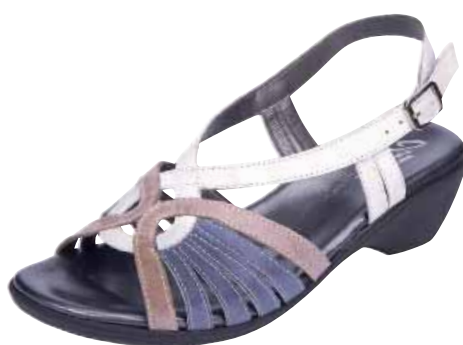
1974 ΧΡΩΜΑ: ΓΚΡΙ / ΓΑΛΑΖΙΟ No: 35 - 41 Λ.Τ.: 55,00 €