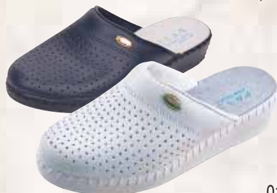
017 ΧΡΩΜΑ: ΛΕΥΚΟ, ΜΠΛΕ No: 35 - 41 Λ.Τ.: 19,00 €