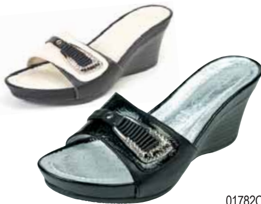
01782C ΧΡΩΜΑ: ΜΑΥΡΟ, ΜΠΕΖ/ΜΑΥΡΟ No: 35 - 41 Λ.Τ.: 35,00 €