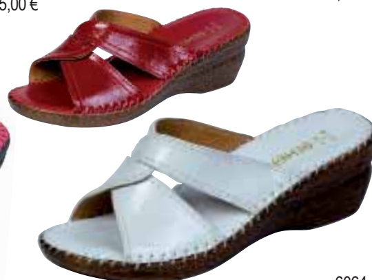
6064 ΧΡΩΜΑ: ΛΕΥΚΟ, ΚΟΚΚΙΝΟ No: 35 - 41 Λ.Τ.: 46,00 €