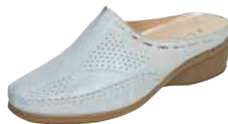
427/23 ΧΡΩΜΑ: ΜΠΕΖ No: 36 - 41 Λ.Τ.: 40,00 €