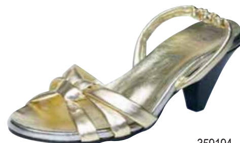
359194 ΧΡΩΜΑ: ΧΡΥΣΟ, ΜΑΥΡΟ No: 35 - 41 Λ.Τ.: 40,00 €