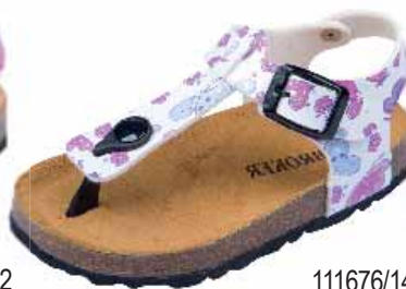
111676/14 ΧΡΩΜΑ: ΛΕΥΚΟ No: 24 - 35 Λ.Τ.: 28,00 €