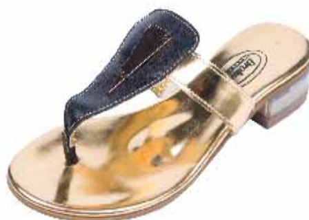
21115 ΧΡΩΜΑ: ΧΡΥΣΟ No: 36 - 41 Λ.Τ.: 58,00 €