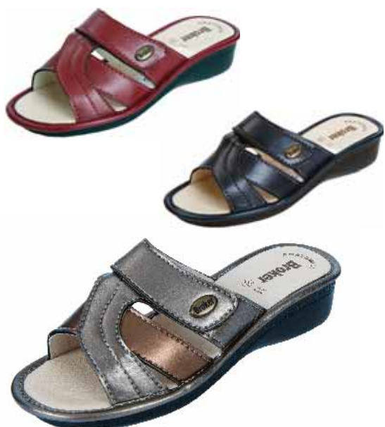
95 ΧΡΩΜΑ: ΜΑΥΡΟ, ΚΟΚΚΙΝΟ, ΜΠΛΕ, ΜΠΡΟΝΖΕ No: 35 - 42 Λ.Τ.: 30,00 €