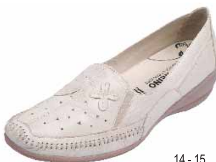
14 - 15 ΧΡΩΜΑ: ΜΑΥΡΟ, ΜΠΕΖ No: 36 - 41 Λ.Τ.: 65,00 €