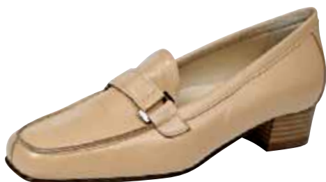
4023 ΧΡΩΜΑ: ΜΠΕΖ, ΜΑΥΡΟ No: 35 - 41 Λ.Τ.: 50,00 €