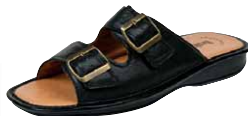
9990 ΧΡΩΜΑ: ΜΑΥΡΟ, ΚΑΦΕ No: 40 - 46 Λ.Τ.: 36,00 €