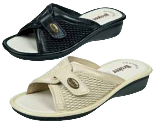
70 ΧΡΩΜΑ: ΜΑΥΡΟ, ΜΠΕΖ No: 35 - 41 Λ.Τ.: 35,00 €