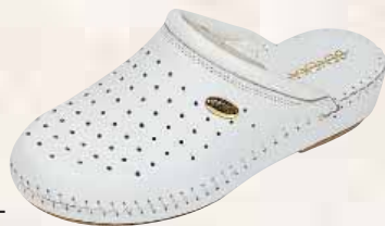
2181/A ΧΡΩΜΑ: ΛΕΥΚΟ, ΜΠΛΕ No: 42 - 46 Λ.Τ.: 38,00 €