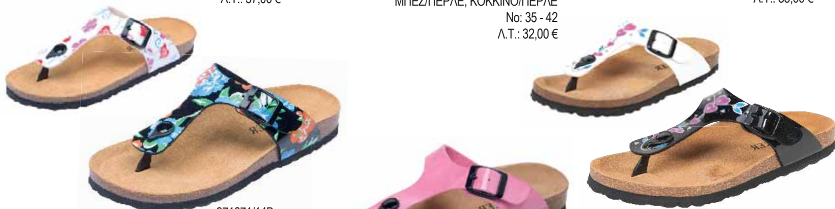
971671/14B ΧΡΩΜΑ: ΜΑΥΡΟ, ΛΕΥΚΟ No: 36 - 42 Λ.Τ.: 32,00 €