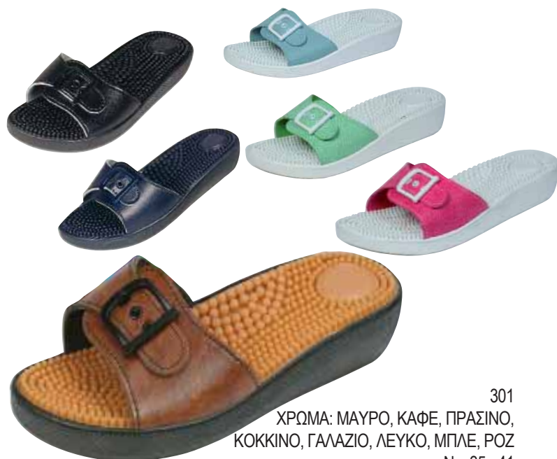
301 ΧΡΩΜΑ: ΜΑΥΡΟ, ΚΑΦΕ, ΠΡΑΣΙΝΟ, ΚΟΚΚΙΝΟ, ΓΑΛΑΖΙΟ, ΛΕΥΚΟ, ΜΠΛΕ, ΡΟΖ No: 35 - 41 Λ.Τ.: 13,00 €