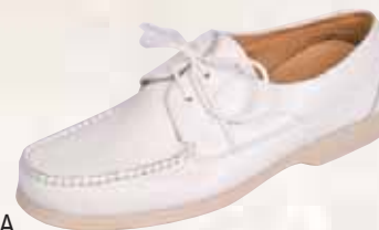
2375 ΧΡΩΜΑ: ΛΕΥΚΟ No: 40 - 46 Λ.Τ.: 62,00 €