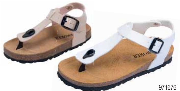
971676 ΧΡΩΜΑ: ΜΑΥΡΟ, ΛΕΥΚΟ, ΜΠΕΖ No: 35 - 42 Λ.Τ.: 35,00 €