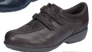
5945/H ΧΡΩΜΑ: ΚΑΦΕ, ΜΑΥΡΟ No: 35 - 41 Λ.Τ.: 120,00 €