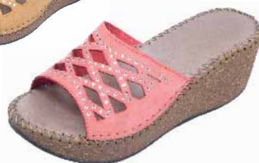
115469C ΧΡΩΜΑ: ΜΑΥΡΟ, ΤΑΜΠΑ, ΣΟΜΟΝ No: 36 - 41 Λ.Τ.: 45,00 €