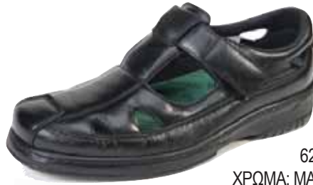
6209/H ΧΡΩΜΑ: ΜΑΥΡΟ No: 40 - 46 Λ.Τ.: 120,00 €