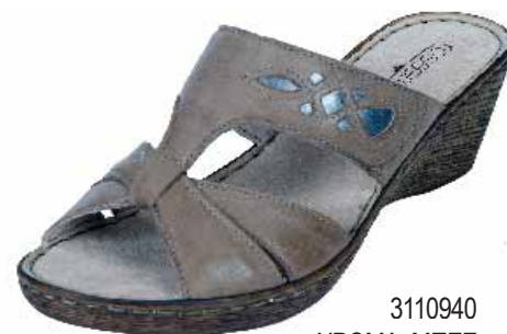
3110940 ΧΡΩΜΑ: ΜΠΕΖ No: 36 - 41 Λ.Τ.: 38,00 €