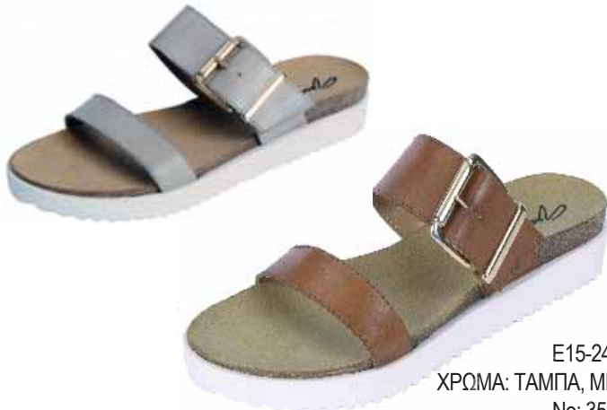
E15-24948 ΧΡΩΜΑ: ΤΑΜΠΑ, ΜΠΕΖ No: 35 - 41 Λ.Τ.: 32,00 €