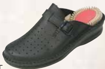
5017/A ΧΡΩΜΑ: ΛΕΥΚΟ, ΜΠΛΕ No: 41 - 46 Λ.Τ.: 45,00 €