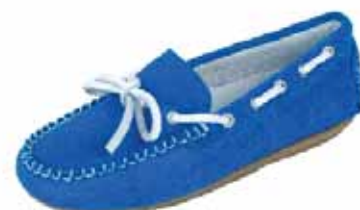
29529A ΧΡΩΜΑ: ΡΟΖ, ΜΠΛΕ No: 24 - 35 Λ.Τ.: 44,00 €