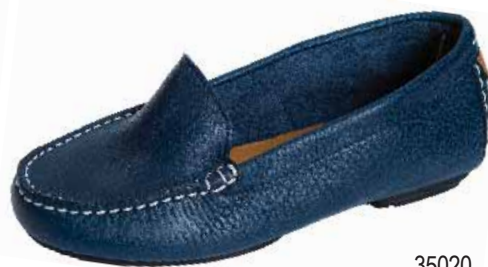
35020 ΧΡΩΜΑ: ΜΠΛΕ No: 36 - 41 Λ.Τ.: 60,00 €