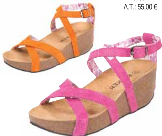
273018 ΧΡΩΜΑ: ΠΟΡΤΟΚΑΛΙ, ΦΟΥΞΙΑ No: 36 - 41 Λ.Τ.: 55,00 €