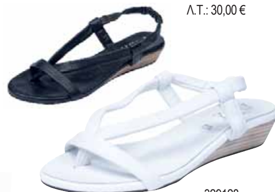
329128 ΧΡΩΜΑ: ΛΕΥΚΟ, ΜΑΥΡΟ No: 35 - 41 Λ.Τ.: 30,00 €