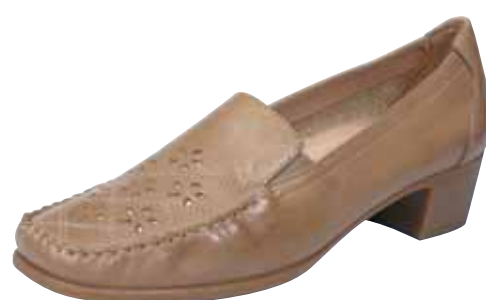
330/13 ΧΡΩΜΑ: ΜΠΕΖ No: 35 - 41 Λ.Τ.: 45,00 €