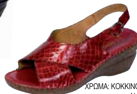
5625 ΧΡΩΜΑ: ΚΟΚΚΙΝΟ, ΜΠΕΖ No: 35 - 41 Λ.Τ.: 40,00 €