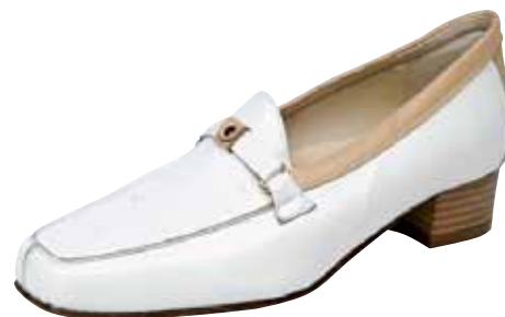
4024 ΧΡΩΜΑ: ΛΕΥΚΟ No: 35 - 41 Λ.Τ.: 50,00 €