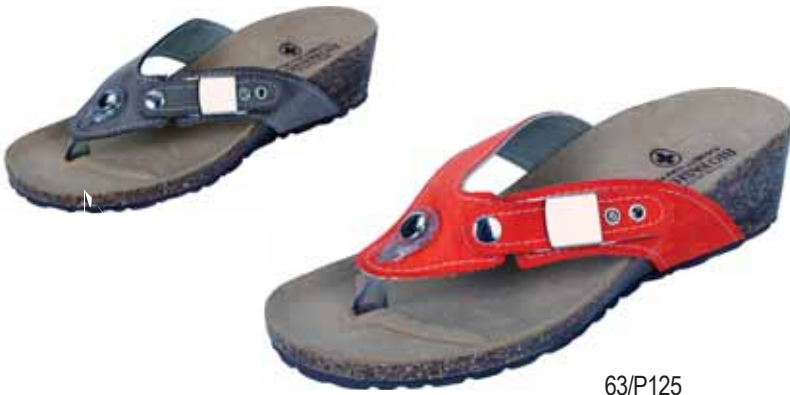
63/P125 ΧΡΩΜΑ: ΠΟΡΤΟΚΑΛΙ, ΓΚΡΙ No: 36 - 41 Λ.Τ.: 30,00 €