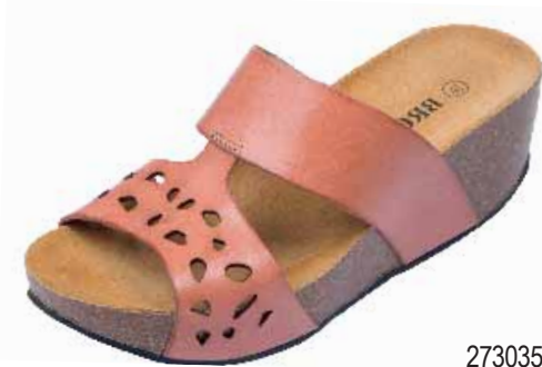
273035 ΧΡΩΜΑ: ΡΟΖ, ΤΑΜΠΑ No: 36 - 41 Λ.Τ.: 47,00 €