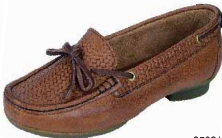
35021 ΧΡΩΜΑ: ΚΑΦΕ No: 36 - 41 Λ.Τ.: 60,00 €