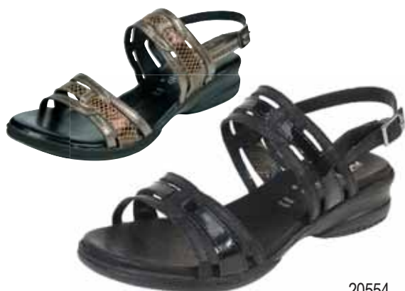
20554 ΧΡΩΜΑ: ΜΑΥΡΟ, ΜΠΡΟΝΖΕ No: 35 - 41 Λ.Τ.: 40,00 €