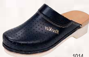
1014 ΧΡΩΜΑ: ΛΕΥΚΟ, ΜΠΛΕ No: 41 - 46 Λ.Τ.: 36,00 €