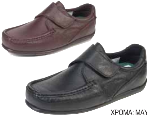
6413/H ΧΡΩΜΑ: ΜΑΥΡΟ, ΚΑΦΕ No: 40 - 46 Λ.Τ.: 120,00 €