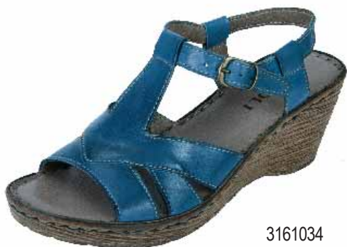
3161034 ΧΡΩΜΑ: ΜΠΛΕ No: 36 - 41 Λ.Τ.: 48,00 €