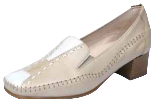
3241/31 ΧΡΩΜΑ: ΜΠΕΖ/ΛΕΥΚΟ No: 36 - 41 Λ.Τ.: 45,00 €