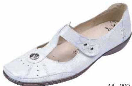
14 - 009 ΧΡΩΜΑ: ΜΑΥΡΟ, ΜΠΕΖ ΠΕΡΛΕ No: 35 - 41 Λ.Τ.: 65,00 €