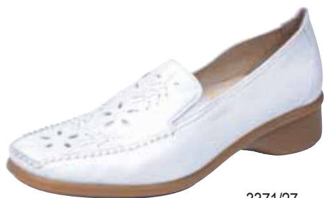
3371/27 ΧΡΩΜΑ: ΕΚΡΟΥ No: 35 - 41 Λ.Τ.: 55,00 €