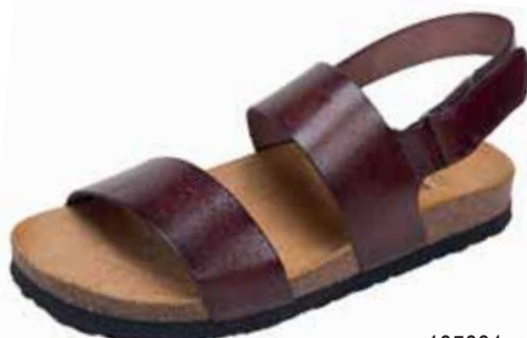
105001 ΧΡΩΜΑ: ΚΑΦΕ, ΜΑΥΡΟ No: 40 - 46 Λ.Τ.: 40,00 €