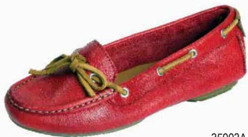
35003A ΧΡΩΜΑ: ΚΟΚΚΙΝΟ No: 35 - 41 Λ.Τ.: 60,00 €