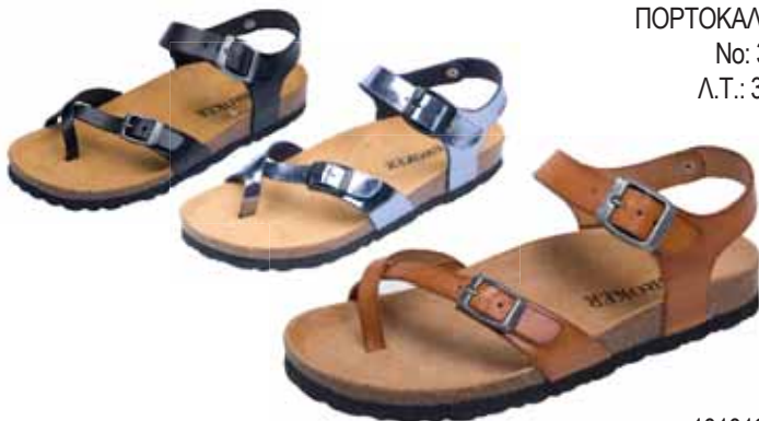
101016 ΧΡΩΜΑ: ΚΑΜΕΛ, ΜΑΥΡΟ, ΓΡΑΦΙΤΗΣ No: 35 - 42 Λ.Τ.: 35,00 €