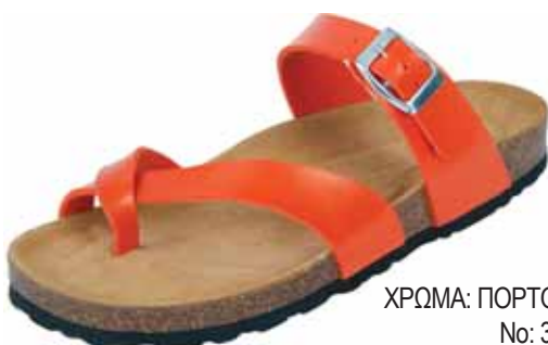
6433 ΧΡΩΜΑ: ΠΟΡΤΟΚΑΛΙ No: 36 - 42 Λ.Τ.: 32,00 €