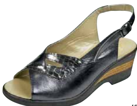
4591 ΧΡΩΜΑ: ΜΑΥΡΟ, ΜΠΡΟΝΖΕ No: 35 - 41 Λ.Τ.: 40,00 €