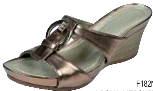
F182N ΧΡΩΜΑ: ΜΠΡΟΝΖΕ No: 35 - 41 Λ.Τ.: 35,00 €