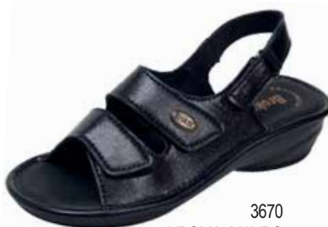
3670 ΧΡΩΜΑ: ΜΑΥΡΟ No: 35 - 41 Λ.Τ.: 35,00 €