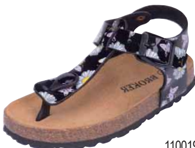
110019/12 ΧΡΩΜΑ: ΜΑΥΡΟ No: 24 - 35 Λ.Τ.: 28,00 €