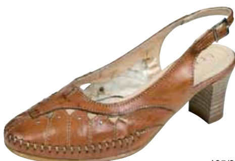
465/31 ΧΡΩΜΑ: ΤΑΜΠΑ No: 35 - 41 Λ.Τ.: 60,00 €