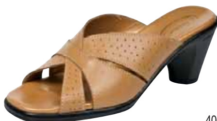
4063 ΧΡΩΜΑ: ΤΑΜΠΑ No: 36 - 41 Λ.Τ.: 25,00 €