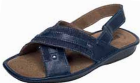
9330/13 ΧΡΩΜΑ: ΜΑΥΡΟ, ΚΑΦΕ No: 40 - 46 Λ.Τ.: 38,00 €