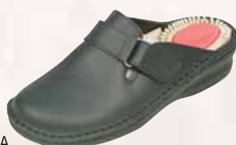
5034/Γ ΧΡΩΜΑ: ΜΑΥΡΟ, ΛΕΥΚΟ, ΜΠΛΕ No: 35 - 41 Λ.Τ.: 42,00 €