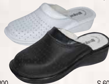
S 6000 ΧΡΩΜΑ: ΛΕΥΚΟ, ΜΑΥΡΟ, ΜΠΛΕ No: 35 - 41 Λ.Τ.: 22,00 €