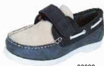
30032 ΧΡΩΜΑ: ΜΠΛΕ No: 24 - 35 Λ.Τ.: 43,00 €