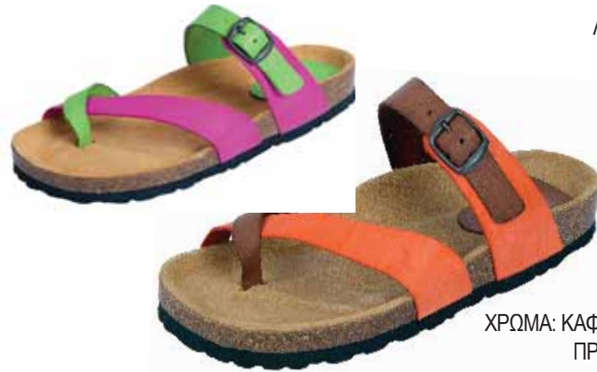
6433 ΧΡΩΜΑ: ΚΑΦΕ/ΠΟΡΤΟΚΑΛΙ, ΠΡΑΣΙΝΟ/ΦΟΥΞΙΑ No: 36 - 42 Λ.Τ.: 37,00 €