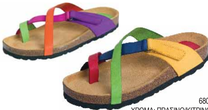
6804 ΧΡΩΜΑ: ΠΡΑΣΙΝΟ/ΚΙΤΡΙΝΟ, ΠΟΡΤΟΚΑΛΙ/ΜΩΒ No: 36 - 42 Λ.Τ.: 37,00 €