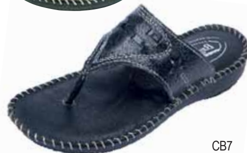
CB7 ΧΡΩΜΑ: ΜΑΥΡΟ, ΜΠΕΖ No: 35 - 41 Λ.Τ.: 30,00 €