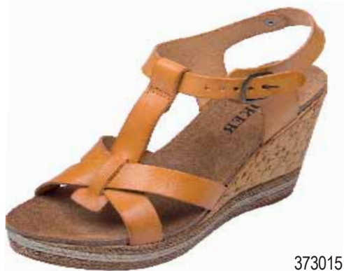
373015 ΧΡΩΜΑ: ΜΑΥΡΟ, ΤΑΜΠΑ, ΜΠΕΖ No: 35 - 41 Λ.Τ.: 55,00 €