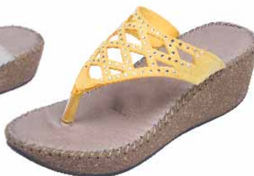
115462C ΧΡΩΜΑ: ΜΑΥΡΟ, ΚΙΤΡΙΝΟ, ΓΚΡΙ, ΤΑΜΠΑ No: 36 - 41 Λ.Τ.: 45,00 €