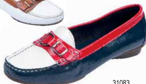
31083 ΧΡΩΜΑ: ΜΠΛΕ/ΚΟΚΚΙΝΟ, ΛΕΥΚΟ/ΤΑΜΠΑ No: 36 - 41 Λ.Τ.: 65,00 €