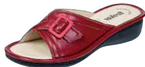
1030/10 ΧΡΩΜΑ: ΜΑΥΡΟ, ΚΟΚΚΙΝΟ No: 35 - 41 Λ.Τ.: 28,00 €