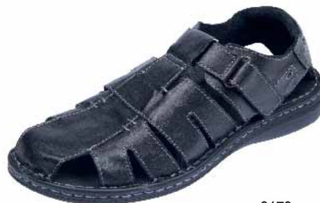
3179 ΧΡΩΜΑ: ΜΑΥΡΟ No: 40 - 46 Λ.Τ.: 52,00 €