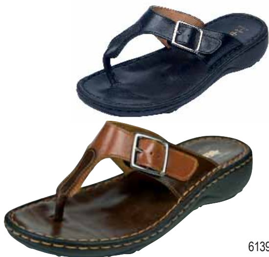
6139 ΧΡΩΜΑ: ΚΑΦΕ No: 35 - 41 Λ.Τ.: 25,00 €