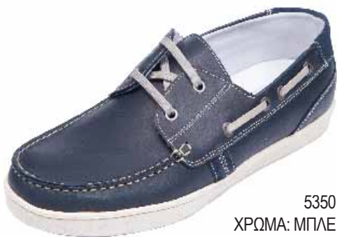
5350 ΧΡΩΜΑ: ΜΠΛΕ No: 40 - 46 Λ.Τ.: 95,00 €