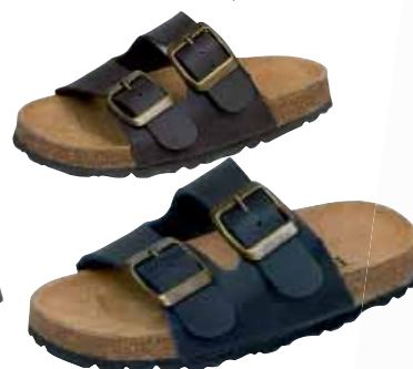
971402 ΧΡΩΜΑ: ΜΠΛΕ, ΚΑΦΕ No: 24 - 35 Λ.Τ.: 20,00 €