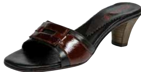
8836 ΧΡΩΜΑ: ΛΕΥΚΟ, ΚΑΦΕ No: 36 - 41 Λ.Τ.: 30,00 €