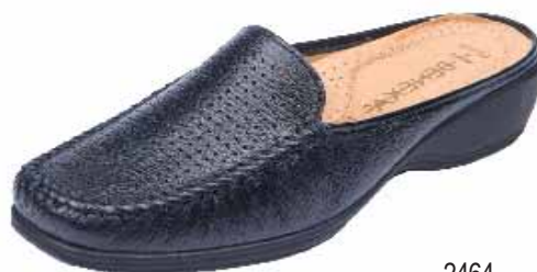
2464 ΧΡΩΜΑ: ΜΑΥΡΟ No: 36-41 Λ.Τ.: 60,00 €