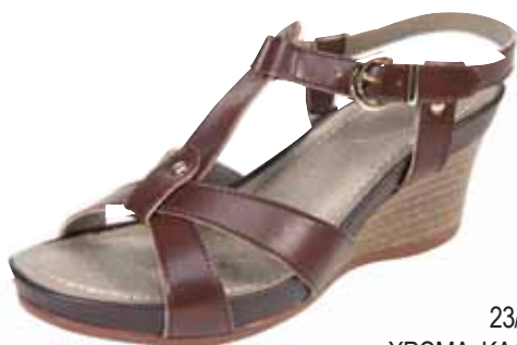
23/42 ΧΡΩΜΑ: ΚΑΦΕ No: 35 - 41 Λ.Τ.: 40,00 €