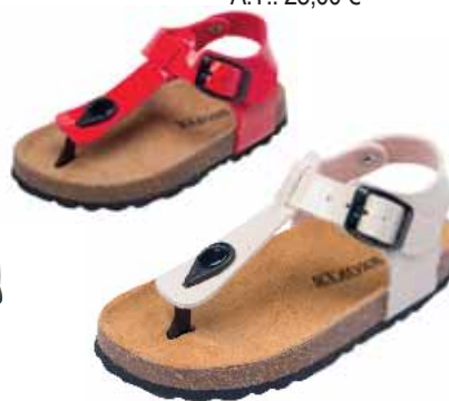
111676 ΧΡΩΜΑ: ΚΟΚΚΙΝΟ, ΜΠΕΖ No: 24 - 35 Λ.Τ.: 28,00 €