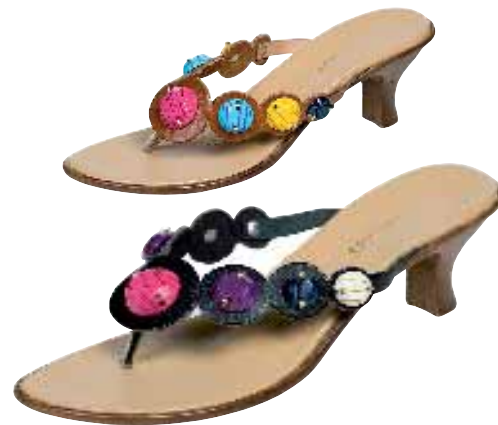
37334-122 ΧΡΩΜΑ: ΜΑΥΡΟ, ΤΑΜΠΑ No: 35 - 41 Λ.Τ.: 25,00 €