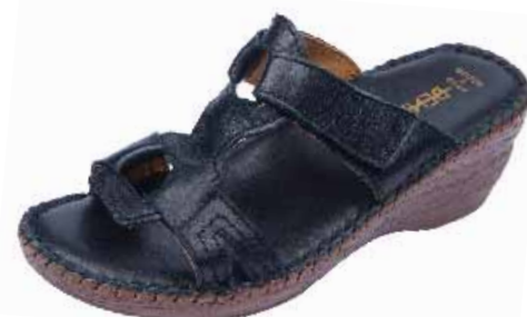
5918 ΧΡΩΜΑ: ΜΑΥΡΟ No: 35 - 41 Λ.Τ.: 45,00 €