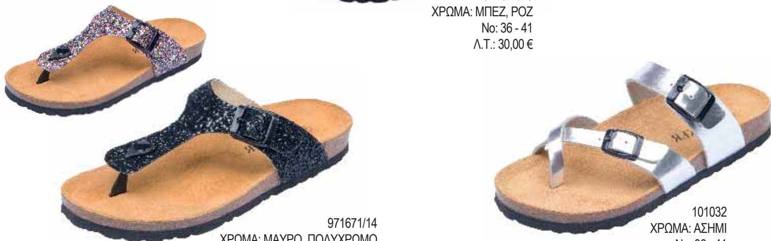
971671/14 ΧΡΩΜΑ: ΜΑΥΡΟ, ΠΟΛΥΧΡΩΜΟ No: 36 - 41 Λ.Τ.: 35,00 €