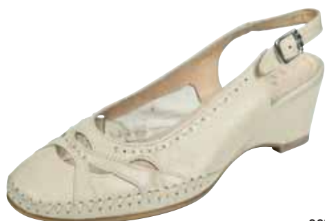
387/55 ΧΡΩΜΑ: ΜΠΕΖ No: 35 - 41 Λ.Τ.: 55,00 €