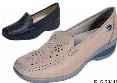
E15-23415 ΧΡΩΜΑ: ΜΠΕΖ, ΜΑΥΡΟ No: 35 - 41 Λ.Τ.: 60,00 €