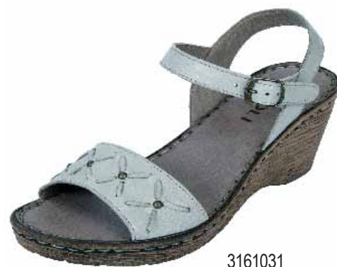
3161031 ΧΡΩΜΑ: ΓΚΡΙ No: 36 - 41 Λ.Τ.: 48,00 €