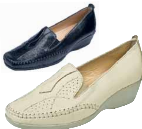
ZV/100 ΧΡΩΜΑ: ΜΑΥΡΟ, ΜΠΕΖ No: 35 - 41 Λ.Τ.: 50,00 €