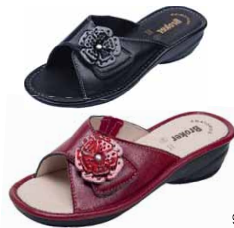
91 ΧΡΩΜΑ: ΜΑΥΡΟ, ΚΟΚΚΙΝΟ No: 35-41 Λ.Τ.: 30,00 €