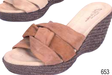
653 ΧΡΩΜΑ: ΜΠΕΖ, ΤΑΜΠΑ No: 35 - 41 Λ.Τ.: 38,00 €