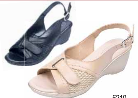
6210 ΧΡΩΜΑ: ΜΠΕΖ, ΜΑΥΡΟ No: 35 - 41 Λ.Τ.: 55,00 €