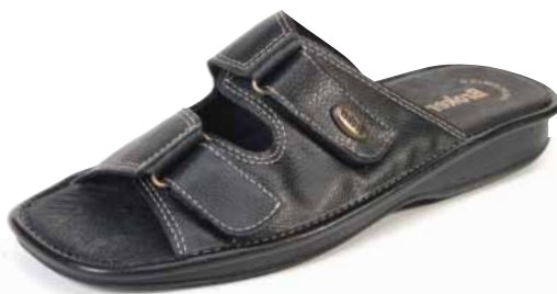
8900 ΧΡΩΜΑ: ΜΑΥΡΟ, ΚΑΦΕ No: 40 - 46 Λ.Τ.: 36,00 €