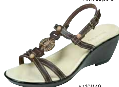
5710/149 ΧΡΩΜΑ: ΚΑΦΕ No: 35 - 41 Λ.Τ.: 30,00 €