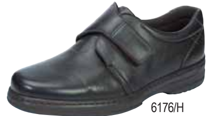
6176/H ΧΡΩΜΑ: ΜΑΥΡΟ, ΚΑΦΕ No: 40 - 46 Λ.Τ.: 120,00 €