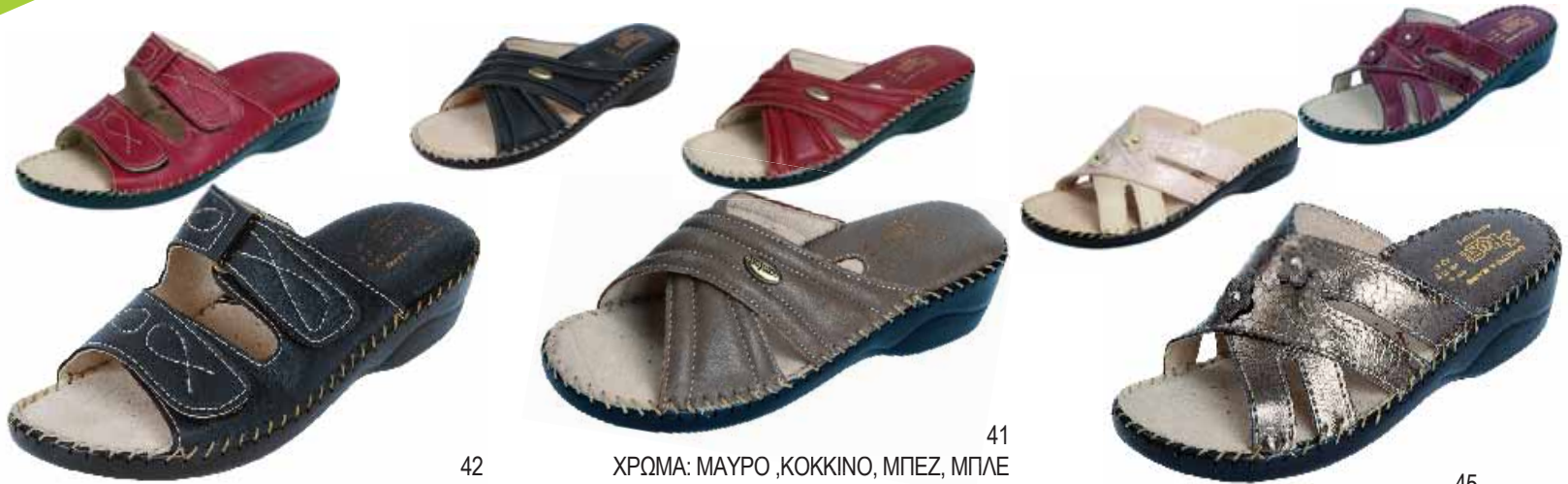
42 ΧΡΩΜΑ: ΜΑΥΡΟ, ΚΟΚΚΙΝΟ, ΜΠΕΖ, ΜΠΛΕ No: 36 - 41 Λ.Τ.: 28,00 €