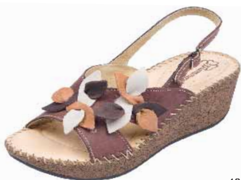
1214 ΧΡΩΜΑ: ΚΑΦΕ No: 36 - 41 Λ.Τ.: 55,00 €