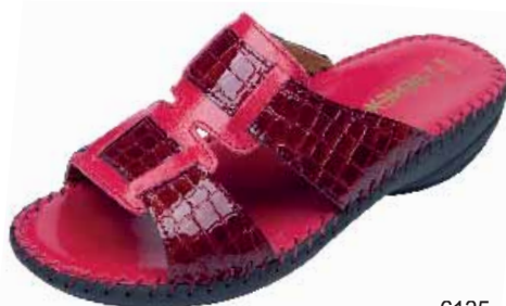
6135 ΧΡΩΜΑ: ΚΟΚΚΙΝΟ No: 35 - 41 Λ.Τ.: 40,00 €