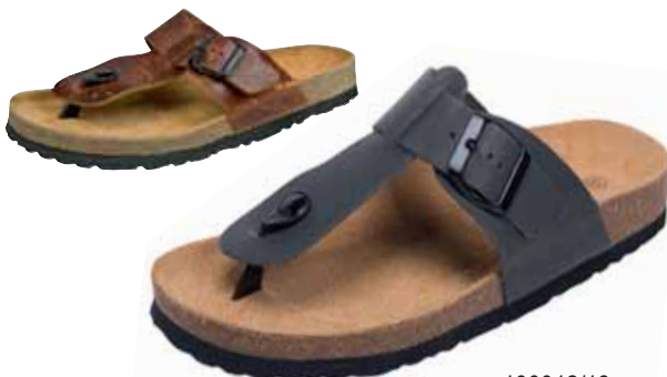
100012/13 ΧΡΩΜΑ: ΜΑΥΡΟ, ΚΑΦΕ No: 40 - 46 Λ.Τ.: 35,00 €