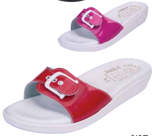
318/Π ΧΡΩΜΑ: ΓΑΛΑΖΙΟ, ΡΟΖ, ΚΟΚΚΙΝΟ, ΜΑΥΡΟ, ΜΠΛΕ No: 36 - 41 Λ.Τ.: 13,00 €