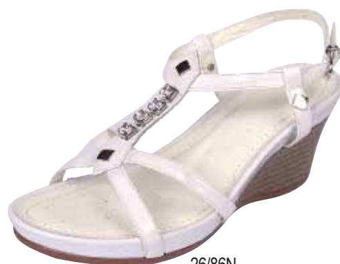
26/86N ΧΡΩΜΑ: ΛΕΥΚΟ No: 36 - 41 Λ.Τ.: 45,00 €