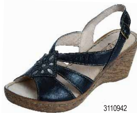
3110942 ΧΡΩΜΑ: ΜΑΥΡΟ No: 36 - 41 Λ.Τ.: 48,00 €