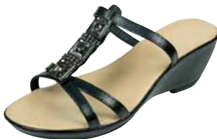
3710/97 ΧΡΩΜΑ: ΜΑΥΡΟ, ΚΑΦΕ No: 35 - 41 Λ.Τ.: 25,00 €