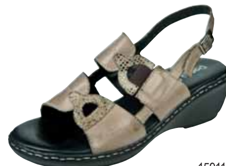
15911 ΧΡΩΜΑ: ΜΠΕΖ, ΜΑΥΡΟ No: 35 - 41 Λ.Τ.: 50,00 €