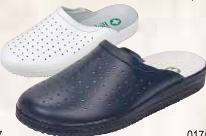
017/A ΧΡΩΜΑ: ΛΕΥΚΟ, ΜΠΛΕ No: 40 - 46 Λ.Τ.: 21,00 €