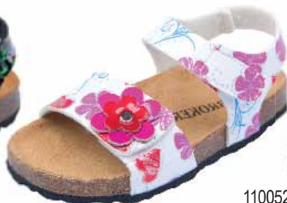
110052 ΧΡΩΜΑ: ΛΕΥΚΟ No: 24 - 35 Λ.Τ.: 28,00 €