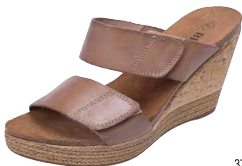
379001 ΧΡΩΜΑ: ΤΑΜΠΑ, ΜΠΕΖ, ΜΑΥΡΟ No: 35 - 41 Λ.Τ.: 55,00 €