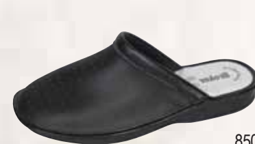
8500 ΧΡΩΜΑ: ΛΕΥΚΟ, ΜΑΥΡΟ, ΜΠΛΕ No: 40 - 46 Λ.Τ.: 22,00 €