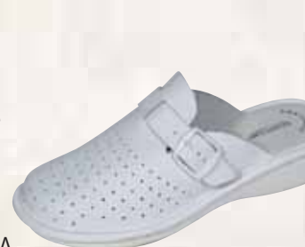
S 5200 ΧΡΩΜΑ: ΛΕΥΚΟ, ΜΑΥΡΟ, ΜΠΛΕ No: 35 - 41 Λ.Τ.: 22,00 €