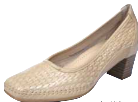
4551/19 ΧΡΩΜΑ: ΜΠΕΖ No: 36 - 41 Λ.Τ.: 60,00 €