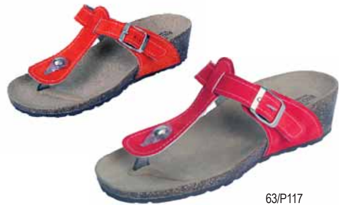
63/P117 ΧΡΩΜΑ: ΚΟΚΚΙΝΟ, ΠΟΡΤΟΚΑΛΙ, ΜΠΕΖ No: 36 - 41 Λ.Τ.: 30,00 €