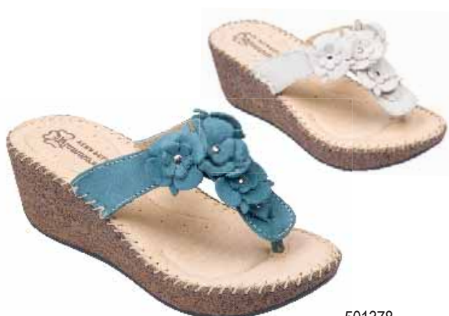
501378 ΧΡΩΜΑ: ΜΑΥΡΟ, ΜΠΕΖ, ΠΕΤΡΟΛ No: 35 - 41 Λ.Τ.: 45,00 €