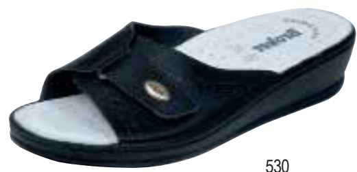
530 ΧΡΩΜΑ: ΜΑΥΡΟ, ΛΕΥΚΟ No: 35 - 41 Λ.Τ.: 24,00 €