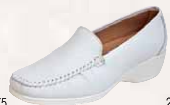
2377 ΧΡΩΜΑ: ΛΕΥΚΟ, ΜΑΥΡΟ, ΜΠΛΕ No: 35 - 41 Λ.Τ.: 62,00 €