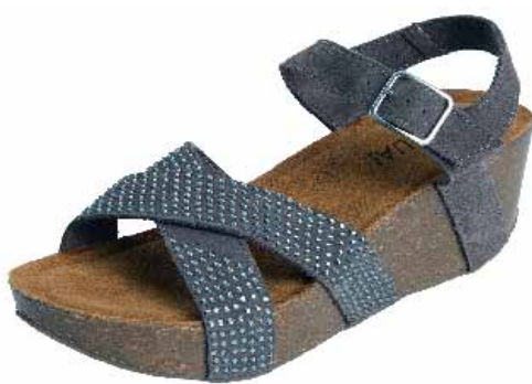
CL3 ΧΡΩΜΑ: ΚΑΜΕΛ, ΜΑΥΡΟ, ΜΠΕΖ No: 36 - 41 Λ.Τ.: 43,00 €