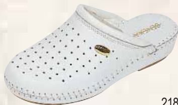
2181/Γ ΧΡΩΜΑ: ΛΕΥΚΟ, ΜΠΛΕ No: 35 - 41 Λ.Τ.: 34,00 €