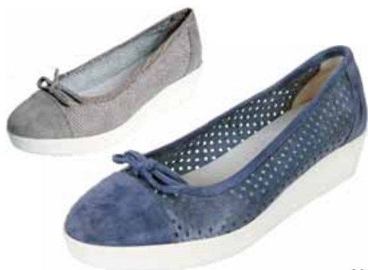
30102 ΧΡΩΜΑ: ΜΠΕΖ, ΓΑΛΑΖΙΟ No: 36 - 41 Λ.Τ.: 73,00 €