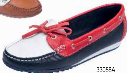
33058A ΧΡΩΜΑ: ΜΠΛΕ/ΚΟΚΚΙΝΟ, ΤΑΜΠΑ/ΛΕΥΚΟ No: 36 - 41 Λ.Τ.: 65,00 €