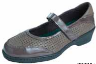
6909/H ΧΡΩΜΑ: ΚΑΦΕ, ΜΑΥΡΟ No: 36 - 41 Λ.Τ.: 120,00 €