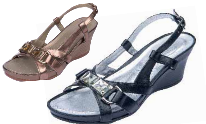
24/84N ΧΡΩΜΑ: ΜΑΥΡΟ, ΜΠΡΟΝΖΕ No: 36 - 41 Λ.Τ.: 40,00 €