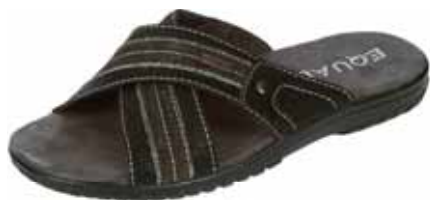
RE 1 ΧΡΩΜΑ: ΚΑΦΕ, ΜΑΥΡΟ No: 40 - 46 Λ.Τ.: 30,00 €