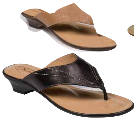
5172/6 ΧΡΩΜΑ: ΜΑΥΡΟ, ΜΠΕΖ No: 35 - 41 Λ.Τ.: 25,00 €