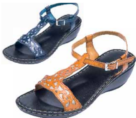
114456C ΧΡΩΜΑ: ΜΠΛΕ, ΤΑΜΠΑ No: 36 - 41 Λ.Τ.: 50,00 €