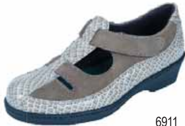
6911 ΧΡΩΜΑ: ΜΑΥΡΟ, ΜΠΕΖ No: 36 - 41 Λ.Τ.: 120,00 €