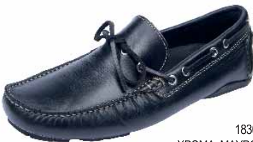
1830 ΧΡΩΜΑ: ΜΑΥΡΟ No: 40 - 46 Λ.Τ.: 75,00 €