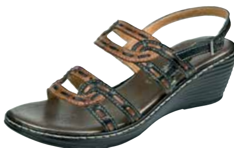
23923 ΧΡΩΜΑ: ΜΑΥΡΟ/ΤΑΜΠΑ, ΚΑΦΕ/ΜΠΕΖ No: 35 - 41 Λ.Τ.: 45,00 €