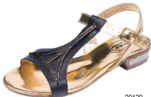
20139 ΧΡΩΜΑ: ΧΡΥΣΟ No: 36 - 41 Λ.Τ.: 65,00 €