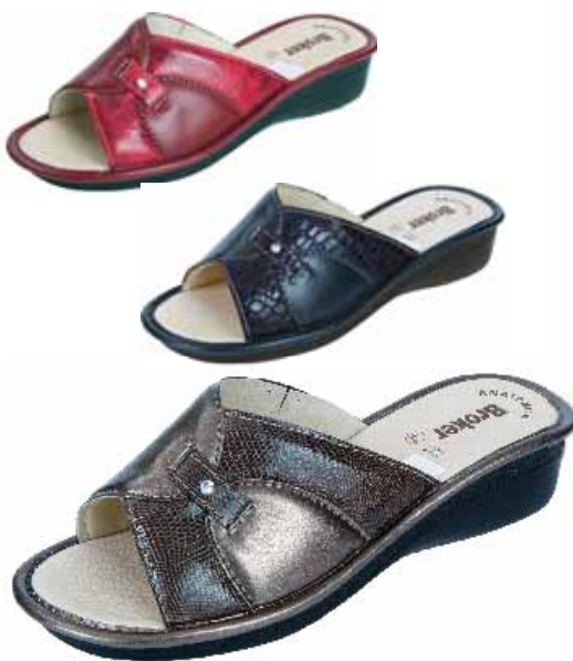
24 ΧΡΩΜΑ: ΜΑΥΡΟ, ΚΟΚΚΙΝΟ, ΜΠΛΕ, ΜΠΡΟΝΖΕ No: 35 - 41 Λ.Τ.: 30,00 €