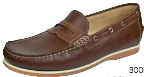
BOOK-2 ΧΡΩΜΑ: ΚΑΦΕ No: 40 - 46 Λ.Τ.: 65,00 €