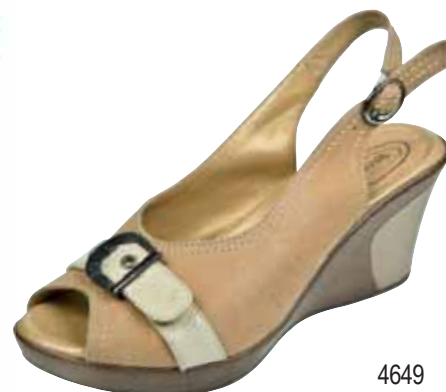
4649 ΧΡΩΜΑ: ΜΠΕΖ No: 35 - 41 Λ.Τ.: 50,00 €