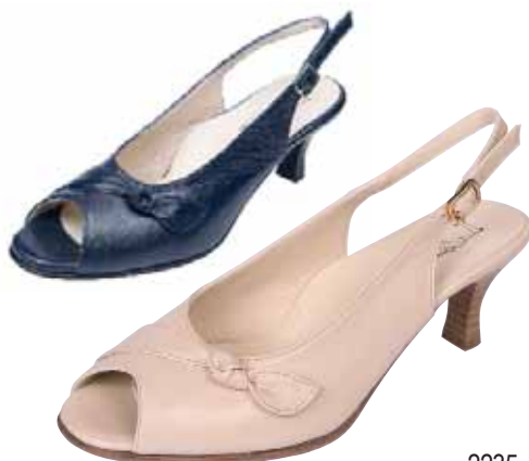
2235 ΧΡΩΜΑ: ΜΠΛΕ, ΜΠΕΖ No: 35 - 41 Λ.Τ.: 55,00 €