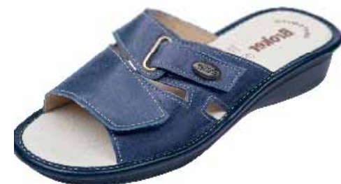
43 ΧΡΩΜΑ: ΜΑΥΡΟ, ΚΟΚΚΙΝΟ, ΜΠΛΕ, ΜΠΡΟΝΖΕ No: 35 - 42 Λ.Τ.: 30,00 €