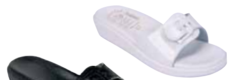
891 ΧΡΩΜΑ: ΜΑΥΡΟ, ΜΠΕΖ No: 36-41 Λ.Τ.: 23,00 €