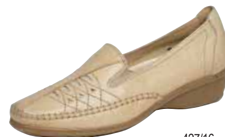
427/16 ΧΡΩΜΑ: ΜΠΕΖ No: 36 - 41 Λ.Τ.: 60,00 €