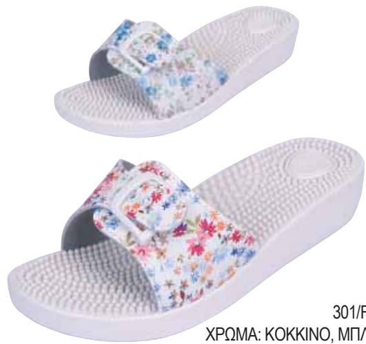
301/FR ΧΡΩΜΑ: ΚΟΚΚΙΝΟ, ΜΠΛΕ No: 35 - 41 Λ.Τ.: 13,00 €