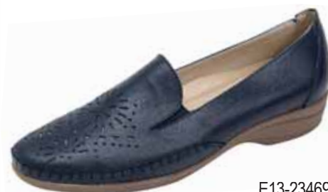
E13-23469 ΧΡΩΜΑ: ΜΑΥΡΟ No: 35 - 41 Λ.Τ.: 60,00 €