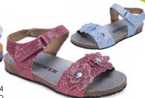
953006 ΧΡΩΜΑ: ΓΑΛΑΖΙΟ, ΡΟΖ No: 24 - 35 Λ.Τ.: 35,00 €