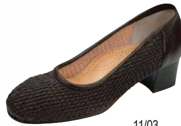
11/03 ΧΡΩΜΑ: ΚΑΦΕ No: 36 - 40 Λ.Τ.: 55,00 €