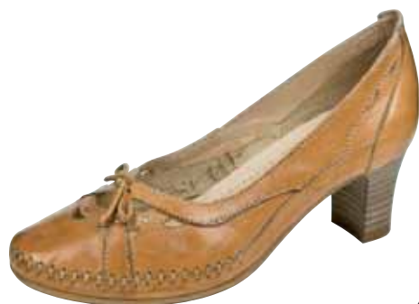
465/20 ΧΡΩΜΑ: ΤΑΜΠΑ No: 35 - 41 Λ.Τ.: 60,00 €