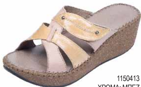
1150413 ΧΡΩΜΑ: ΜΠΕΖ No: 36 - 41 Λ.Τ.: 45,00 €