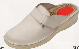
5034/A ΧΡΩΜΑ: ΛΕΥΚΟ, ΜΑΥΡΟ, ΜΠΛΕ No: 41 - 46 Λ.Τ.: 49,00 €