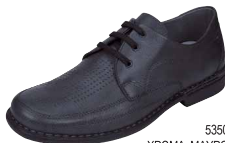
5350 ΧΡΩΜΑ: ΜΑΥΡΟ No: 40 - 46 Λ.Τ.: 85,00 €