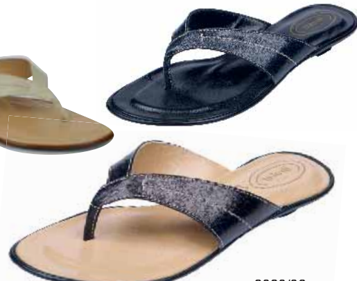
3080/06 ΧΡΩΜΑ: ΠΡΑΣΙΝΟ, ΜΠΛΕ, ΜΑΥΡΟ, ΛΕΥΚΟ No: 36 - 41 Λ.Τ.: 25,00 €