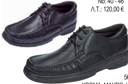
5606/H ΧΡΩΜΑ: ΜΑΥΡΟ, ΚΑΦΕ No: 40 - 46 Λ.Τ.: 120,00 €