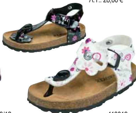
110019 ΧΡΩΜΑ: ΜΑΥΡΟ, ΛΕΥΚΟ No: 24 - 35 Λ.Τ.: 28,00 €