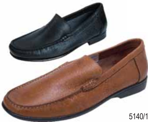
5140/13 ΧΡΩΜΑ: ΤΑΜΠΑ, ΜΑΥΡΟ No: 41 - 46 Λ.Τ.: 85,00 €