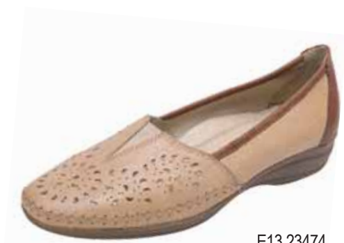
E13 23474 ΧΡΩΜΑ: ΜΠΕΖ, ΜΑΥΡΟ No: 36 - 41 Λ.Τ.: 60,00 €