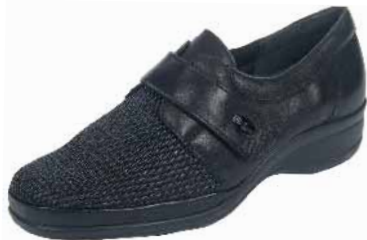
112 - 23413 ΧΡΩΜΑ: ΜΑΥΡΟ No: 36 - 41 Λ.Τ.: 68,00 €