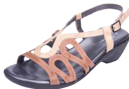
3012 ΧΡΩΜΑ: ΚΑΦΕ / ΜΠΕΖ No: 35 - 41 Λ.Τ.: 55,00 €