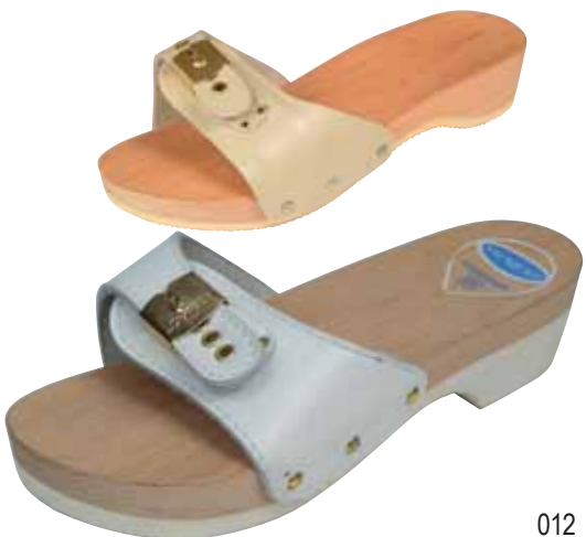
012 ΧΡΩΜΑ: ΛΕΥΚΟ, ΜΠΕΖ, ΜΠΛΕ No: 36 - 41 Λ.Τ.: 25,00 €