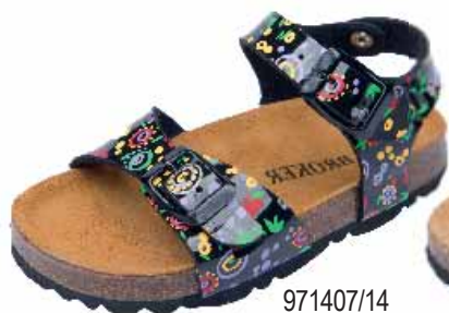
971407/14 ΧΡΩΜΑ: ΜΑΥΡΟ No: 24 - 35 Λ.Τ.: 28,00 €