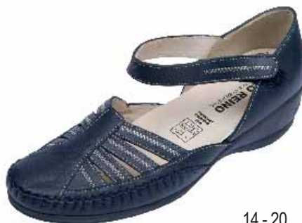
14 - 20 ΧΡΩΜΑ: ΜΑΥΡΟ, ΜΠΛΕ No: 36 - 41 Λ.Τ.: 65,00 €