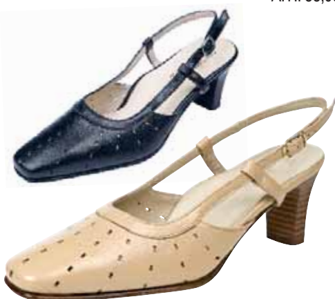
4020 ΧΡΩΜΑ: ΜΠΕΖ, ΜΑΥΡΟ No: 35 - 41 Λ.Τ.: 50,00 €