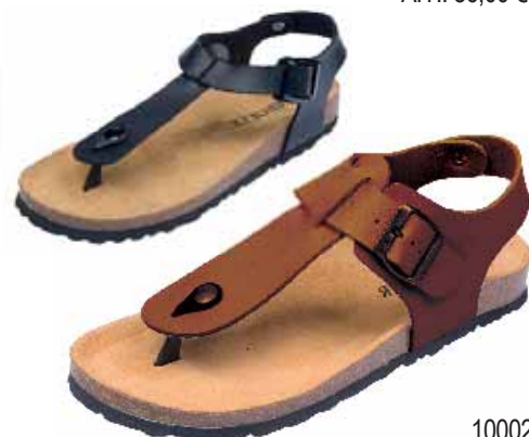
100020 ΧΡΩΜΑ: ΚΑΦΕ, ΜΑΥΡΟ No: 40 - 46 Λ.Τ.: 38,00 €