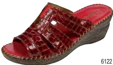
6122 ΧΡΩΜΑ: ΜΠΟΡΝΤΩ No: 35 - 41 Λ.Τ.: 50,00 €