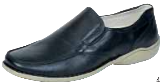
4356 ΧΡΩΜΑ: ΜΑΥΡΟ, ΜΠΕΖ No: 40 - 46 Λ.Τ.: 45,00 €