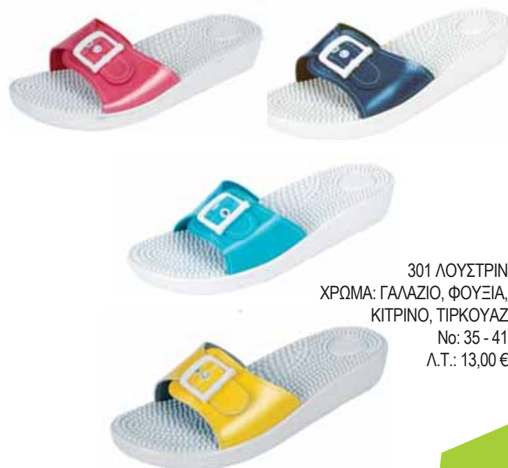
301 ΛΟΥΣΤΡΙΝ ΧΡΩΜΑ: ΓΑΛΑΖΙΟ, ΦΟΥΞΙΑ, ΚΙΤΡΙΝΟ, ΤΙΡΚΟΥΑΖ No: 35 - 41 Λ.Τ.: 13,00 €