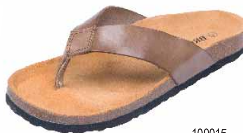
100015 ΧΡΩΜΑ: ΚΑΦΕ, ΜΑΥΡΟ No: 40 - 46 Λ.Τ.: 35,00 €