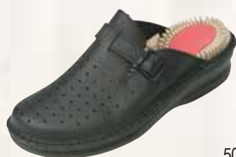
5017/Γ ΧΡΩΜΑ: ΛΕΥΚΟ, ΜΠΛΕ No: 35 - 41 Λ.Τ.: 37,00 €