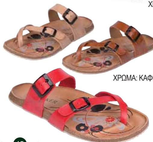
141032 ΧΡΩΜΑ: ΚΑΦΕ, ΜΠΕΖ, ΜΑΥΡΟ, ΚΟΚΚΙΝΟ No: 35 - 41 Λ.Τ.: 26,00 €