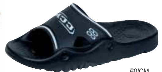
60/CM ΧΡΩΜΑ: ΜΑΥΡΟ No: 40 - 46 Λ.Τ.: 18,00 €