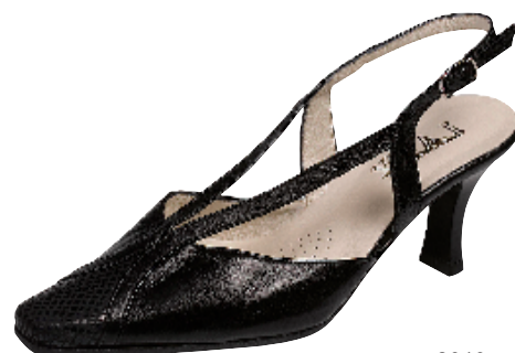
2019 ΧΡΩΜΑ: ΜΑΥΡΟ No: 35 - 41 Λ.Τ.: 50,00 €