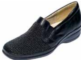
112 - 23414 ΧΡΩΜΑ: ΜΑΥΡΟ No: 36 - 41 Λ.Τ.: 68,00 €