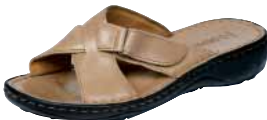
5597 ΧΡΩΜΑ: ΜΑΥΡΟ, ΠΟΡΤΟΚΑΛΙ, ΜΠΕΖ, ΚΟΚΚΙΝΟ No: 35-41 Λ.Τ.: 40,00 €