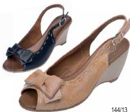
144/13 ΧΡΩΜΑ: ΜΑΥΡΟ, ΤΑΜΠΑ No: 36 - 41 Λ.Τ.: 65,00 €