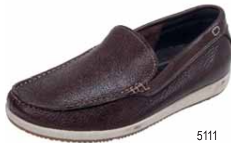
5111 ΧΡΩΜΑ: ΚΑΦΕ No: 40 - 46 Λ.Τ.: 85,00 €